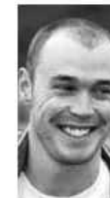
■ Річард Бернс: разом з Subaru двічі, у 1999 і 2000 роках, став віце-чемпіоном, а в 2001 році виборов чемпіонський титул

У 2009 році на заводських автомобілях Impreza WRC2008 епізодично виступали приватні команди. У кількох етапах взяла участь норвезька Adapta Subaru, основний пілот якої Мадс Естберг за підсумками сезону посів 11-е місце у особистому заліку. А Маркус Гронхольм на ралі Португалії виступив під прапором Prodrive — це був його єдиний старт того сезону і, на жаль, без очкового фінішу.