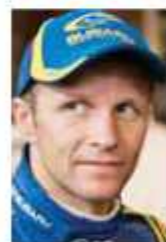
■ Петер Сольберг: у 2002-му вперше переміг на етапі WRC, а вже наступного року став з Subaru чемпіоном світу

Зате у 2003-му Subaru вчергове святкувала гучний успіх: усього за рік після своєї першої перемоги Петер Сольберг був коронований як новий чемпіон світу! На шляху до титулу він виборов чотири перемоги. А особливо яскравим видався фінальний етап сезону, перед яким норвежець займав третє місце у загальному заліку, поступаючись одним очком пілотам Citroen Карлосу Сайнсу і Себастьяну Льобу. Для завоювання титулу Сольбергу була необхідна перемога — і він її здобув: блискуче лідирував від першого до останнього догу і у напруженій боротьбі здолав обох суперників.