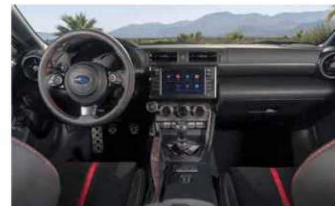
■ Гармонія: Інтер'єр нового Subaru BRZ гармонійно поєднує спорт і комфорт.

Виробництво Subaru BRZ другого покоління буде налагоджено на заводі Subaru Gunma у Японії, а у продаж автомобіль надійде восени 2021 року. ☺