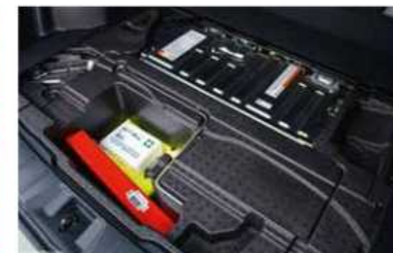
■ Оптимальна компоновка: акумуляторний блок системи e-BOXER розташовано безпосередньо під полом багажника