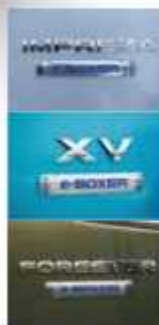
■ Три моделі гібридна система e-BOXER доступна на моделях XV, Impreza та Forester

При руханні з місця та русі з низькою швидкістю система e-BOXER задіє електромотор, що забезпечує безшумну їзду з нульовим рівнем шкідливих викидів. Залежно від ступеня зарядки аку-