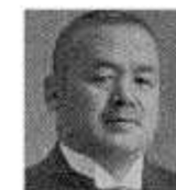
■ Чікухай Накаджіма: засновник компанії Aircraft Research Laboratory, попередниці Subaru

У подальшому Subaru розширять модельний ряд з акцентом на сегмент SUV&XUV, де бренд вже багато років поспіль займає лідерські позиції. Наші значні компетенції, багаторічний досвід та нескінченна наснага допомагають створювати найкращі автомобілі для подіювачів активного способу життя.